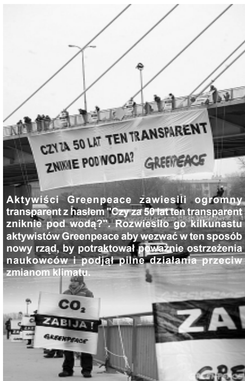
Aktywiści Greenpeace zawiesili ogromny transparent z hasłem "Czy za 50 lat ten transparent zniknie pod wodą?". Rozwiesiło go kilkunastu aktywistów Greenpeace aby wezwać w ten sposób nowy rząd, by potraktował poważnie ostrzeżenia naukowców i podjął pilne działania przeciw zmianom klimatu.